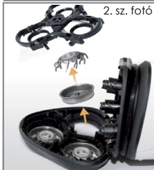
2. sz. fotó

A kések és a sziták olyan üzemeltetési kellékek, amelyeket rendszeresen cserélni kell. Nem tartoznak a garancia hatálya alá