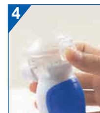
Zamknij pokrywę zbiornika