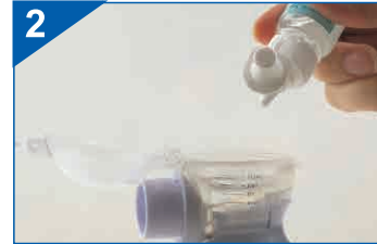
Wlej odpowiednią ilość leku nie przekraczając maksymalnej granicy (skala oznaczona z boku zbiornika)