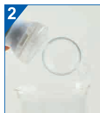
Otwórz zbiornik i usuń pozostałości po leku