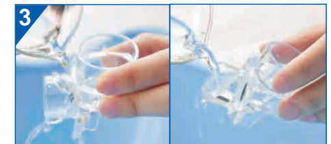
Wyczyść wylot zbiornika zewnątrz i wewnątrz

Powtórz kilkakrotnie powyższe czynności używając czystej wody o temperaturze nie większej niż 40°C. Osusz dokładnie wszystkie elementy delikatną szmatką lub gazą nie dotykając membrany i odstaw je w suche miejsce aż do następnego użycia