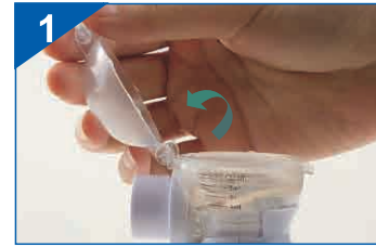
Otwórz pokrywę zbiornika na lek