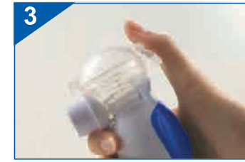
Zamknij pokrywę zbiornika