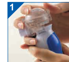
Zdejmij zbiornik na lek z jednostki głównej zsuwając go po szynach. Przetrzyj urządzenie wilgotną szmatką i osusz.