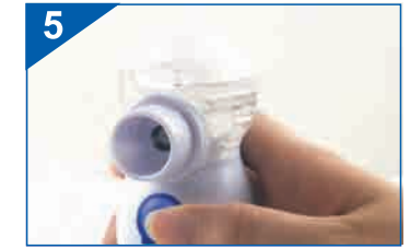
Inhalator przygotowany jest do pracy. Możesz rozpocząć inhalację naciskając przycisk włączający.