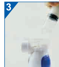
Nalej do zbiornika ciepłą wodę (max. 40°C). Nie używaj wody destylowanej i wielokrotnie filtrowanej