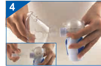
Założ maskę na wylot zbiornika