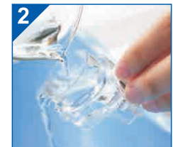
Wyczyść wewnątrz zbiornika