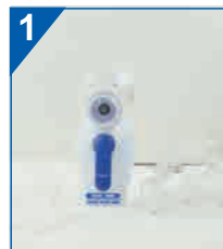
Zdejmij maskę lub ustnik z wylotu zbiornika na lek